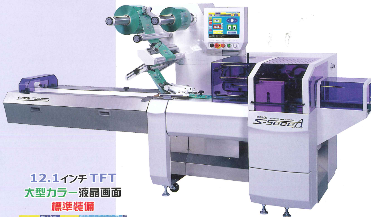
▲ S-5000A BX-BIN