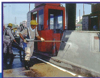
●コンクリート壁の汚れ落とし