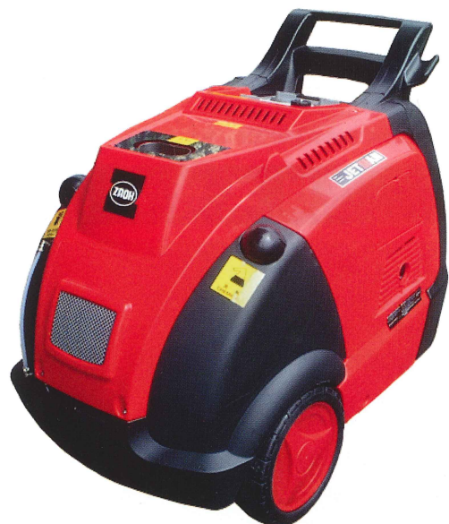
GHD-1714 及び 1813